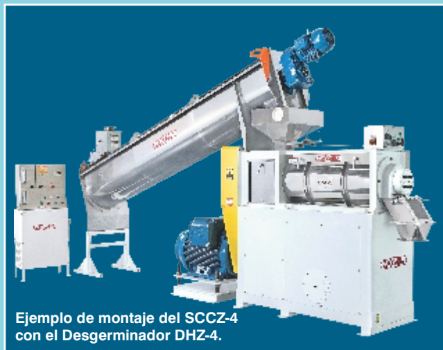
Ejemplo de montaje del SCCZ-4 con el Desgerminador DHZ-4.

A = 2515 A = 2840 A = 3502 A = 3975 B = 1470 B = 1670 B = 2070 B = 2290 C = 1085 C = 1235 C = 1360 C = 1435 D = 640 D = 740 D = 889 D = 1050