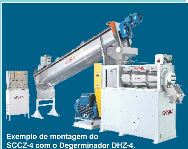
Exemplo de montagem do SCCZ-4 com o Degerminador DHZ-4.

A = 2515 A = 2840 A = 3502 A = 3975 B = 1470 B = 1670 B = 2070 B = 2290 C = 1085 C = 1235 C = 1360 C = 1435 D = 640 D = 740 D = 889 D = 1050