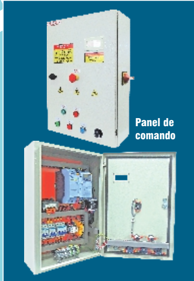
Panel de comando