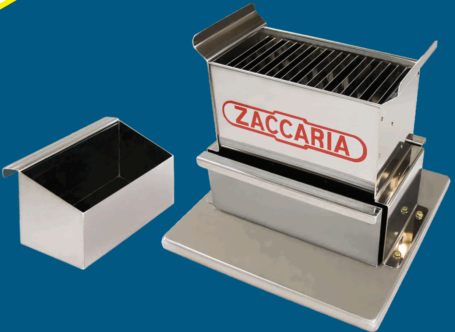
Cuarteador de Muestras QAZ-1