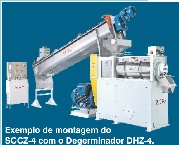
Exemplo de montagem do SCCZ-4 com o Degerminador DHZ-4.