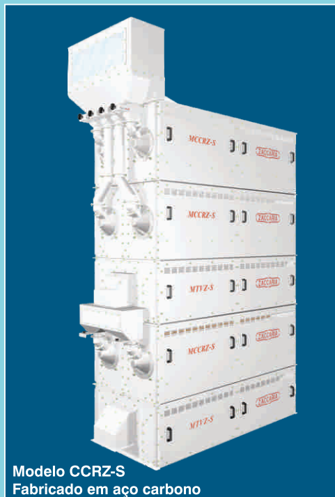
Modelo CCRZ-S Fabricado em aço carbono

Obs.: - Produção em kg/h, baseada em testes com arroz longo fino.