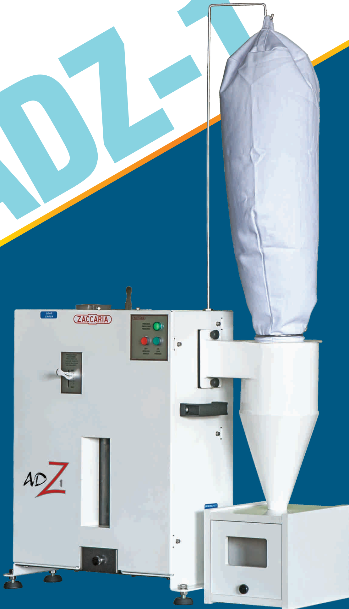
Analizador Densimétrico ADZ-1