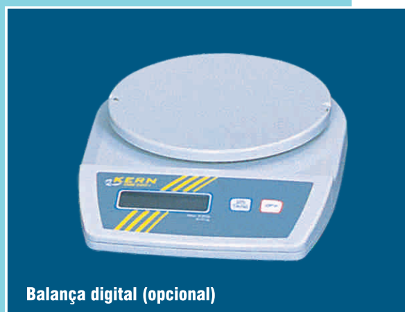
Balança digital (opcional)

..... Indústrias Machina Zaccaria S/A reserva-se no direito de alteração das informações contidas neste catálogo, cor do equipamento e seus detalhes, sem prévio aviso.