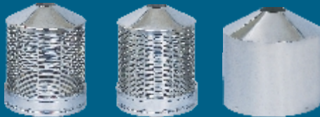
Conjunto clasificador de perfil para prueba de cereales (opcionales).