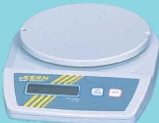
Balanza Digital (opcional)

Indústrias Machina Zaccaria S/A se reserva el derecho de alterar las informaciones contenidas en este catálogo, color del equipo y sus detalles, sin previo aviso.