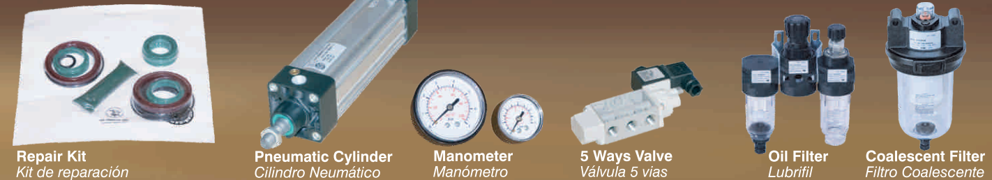
Repair Kit Kit de reparación