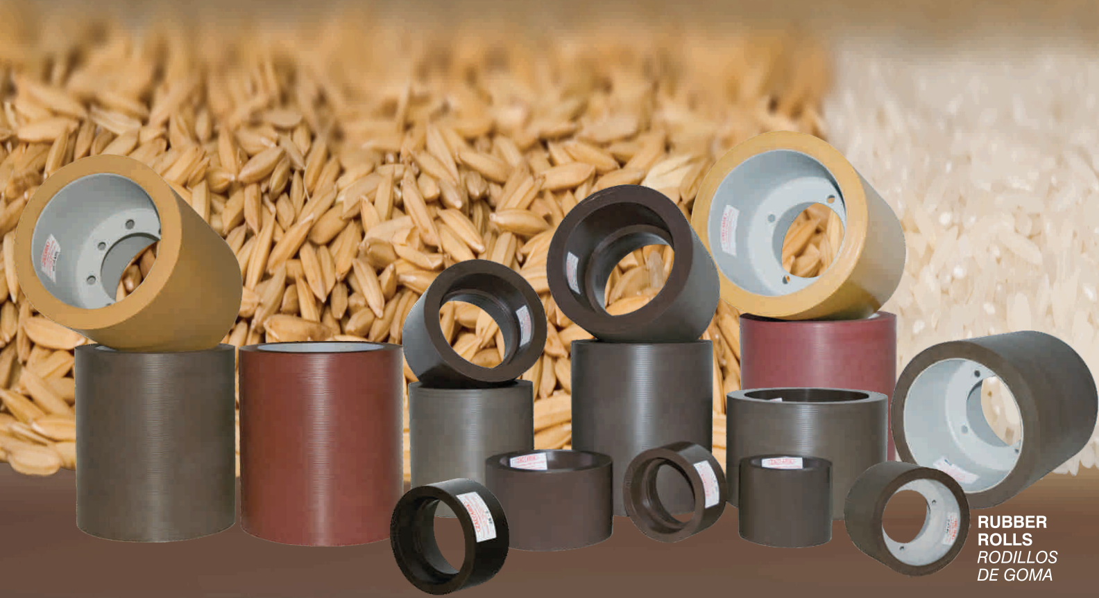
RUBBER ROLLS RODILLOS DE GOMA

Original Spare Parts Repuestos Originales