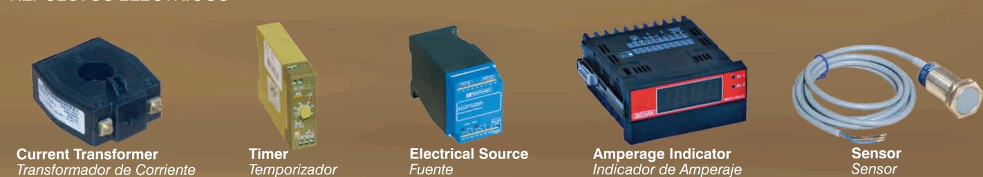
Current Transformer Transformador de Corriente