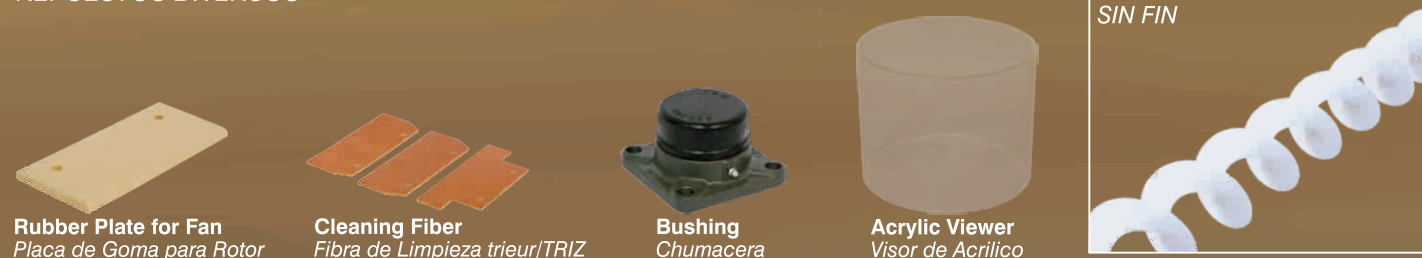
Rubber Plate for Fan Placa de Goma para Rotor