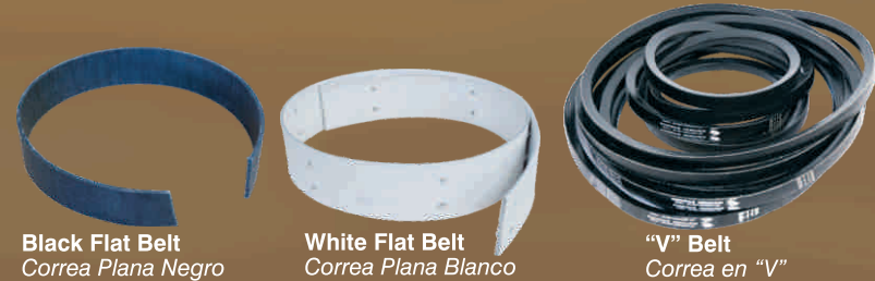
Black Flat Belt Correa Plana Negro